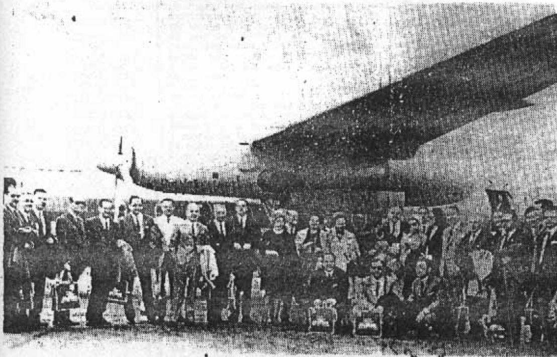
Autoridades de la provincia de Las Palmas e invitados que ayer marcharon a París en el vuelo inaugural de Iberia Canarias-Málaga-París.

Fue visto cuando el DC-9 de Iberia sobrevolaba Logroño